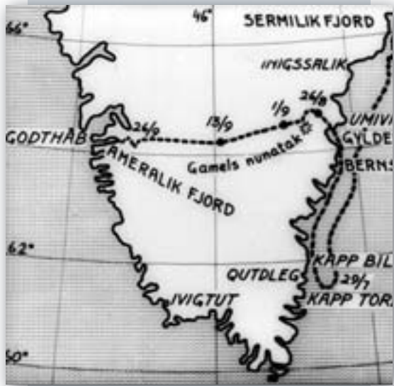
FORSINKET: Nansens rute i drivisen på østsiden og over innlandsisen fram til Godthåb.