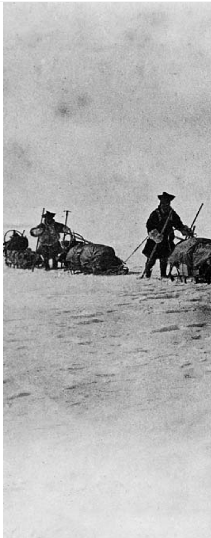
SLIT: Sledene veide 100 kilo og ble dratt av mennene selv fordi

Huntford, Roland: Fridtjof Nansen. 2003.