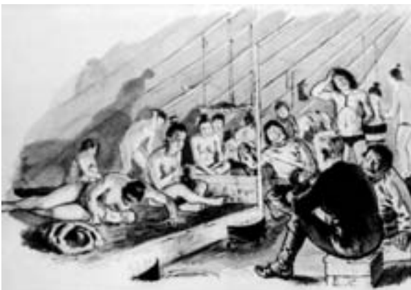
NATURLIG: Karene rødmet da de ble invitert inn til inuittene. Kvinner og menn gikk nakne innendørs.

noen blikkflasker som de fyller med snø og bærer innerst på brystet. Men den mengden snø som tiner på denne måten, er helt utilstrekkelig. De får ikke mer væske før de slår seg til ro i teltet. Også matrasjonene er knappe, de er alltid sultne.