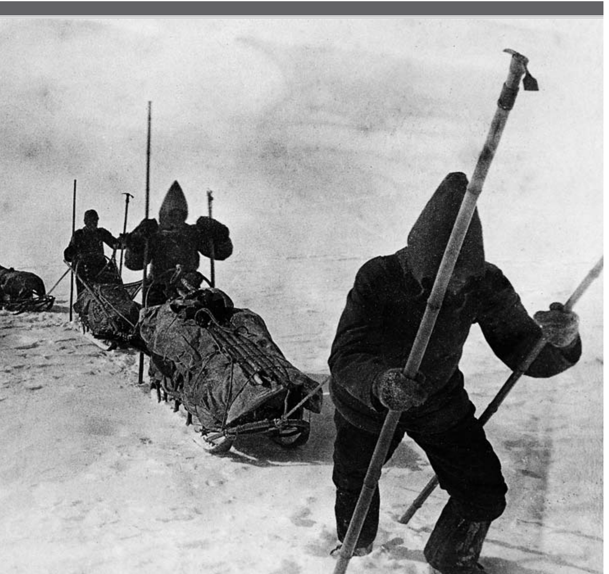
trekkhunder ikke var å få tak i. Temperaturen falt til minus 45. Det største problemet var likevel ikke kulden, men mangelen på vann.