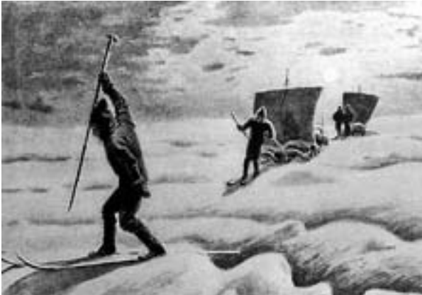
RISIKO: Farten økte da seil ble montert på sledene. Her tegning av farefull seilas over bresprekker i måneskinn.

DET ER sommer, men temperaturen når minus 45 på det kaldeste. Likevel er det ikke kulden som plager dem mest. Det er tørsten. Det er ikke vann oppe på isen. Nansen har tatt med