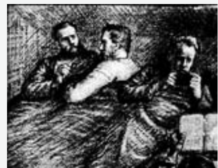
TETLIV: Ekspedisjonen hadde to soveposer av reinskinn som tre mann delte.